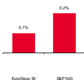
Futures (9.10.2019, 8:15 CET)