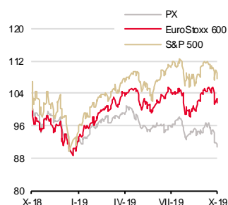
Vývoj indexů za 12 měsíců