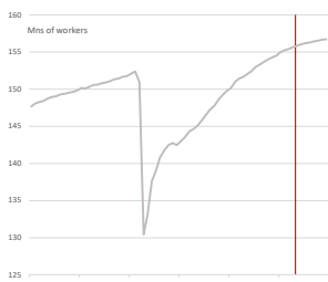
USA: Zaměstnanost v nezemědělském sektoru (v mil.)