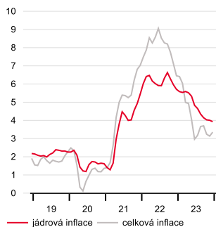
Inflace v USA (y/y, %)