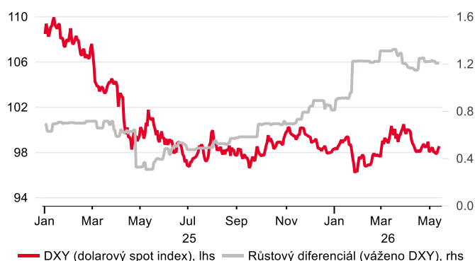
Růstový náskok USA by měl pokračovat